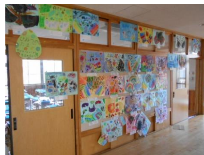
〔きれいな作品が並ぶ2年生廊下〕

6月に入って通常授業をあたりまえのように送ることができています。もちろん、コロナウイルスの感染予防対策を一人一人がしっかりと意識し、守っているからこそです。以前は感じなかったこうしたありがたみを感じられることに感謝しながら、一日一日を送っていけるといいです。しかし、このところの気温の上昇によって、マスクをしていると苦しくなったり、水泳学習が始まったりと別の課題も出てきています。それらに対しても、どうしたらできるのか解決するのかを考え、工夫しながら取り組んでいきたいと思えます。保護者の皆様にもご協力いただくことがあるかと思えますが、よろしくお願ひします。