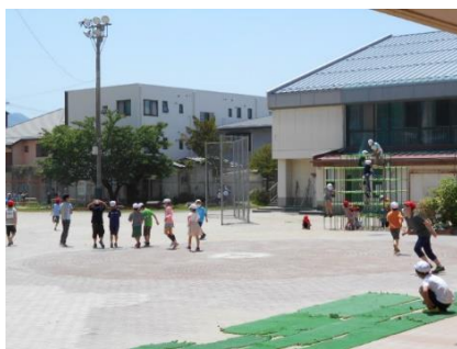
〔休み時間・校庭や中庭で多くの児童が遊んでいます〕