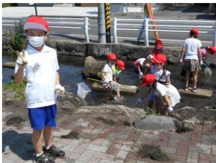
〔なかよし川辺で遊ぶ1年生〕