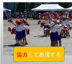
協力して表現する