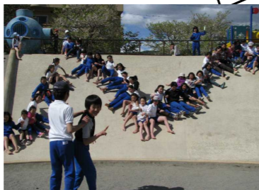
▲4月みずべ公園へのお花見練習