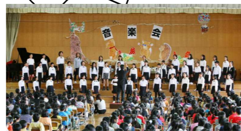
▲校内音楽会 今年48名の仲間で活動