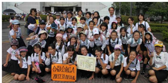
▲合唱大会2年連続金賞 県大会へ