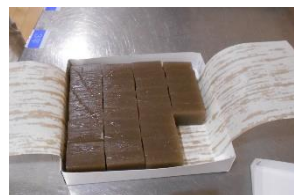
新鶴様からいただいた